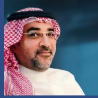
رئيس إدارة الوساطة في الأوراق المالية