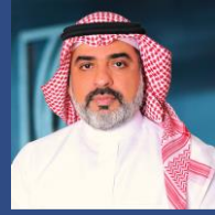
رئيس إدارة الثروات والرئيس المكلف لإدارة الأصول