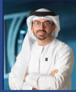
نائب رئيس مجلس الإدارة